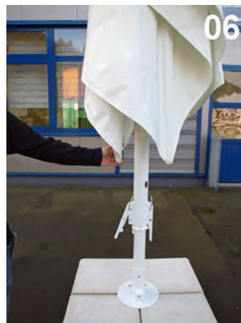
06 Lad spændingslåsen stå åben som afbilledet her.