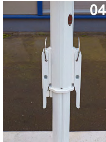
04 ...tag cylindrene ud af spændingslåsene.