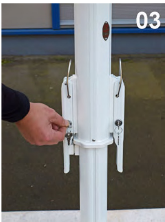
03 Lås op for spændingslåsene med nøglen og ...