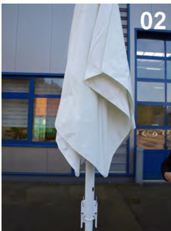
02 Første skridt: Afmonter spænder og remme.