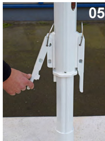
05 Løft op for at frigøre den venstre spændingslås fra sin lukkede position på stolpen af parasollen.