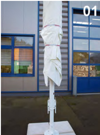
01 JM-B i uåbnet stand.

Den maksimale vindbelastning i opslået tilstand for JM-B afhænger af størrelsen på parasollen.