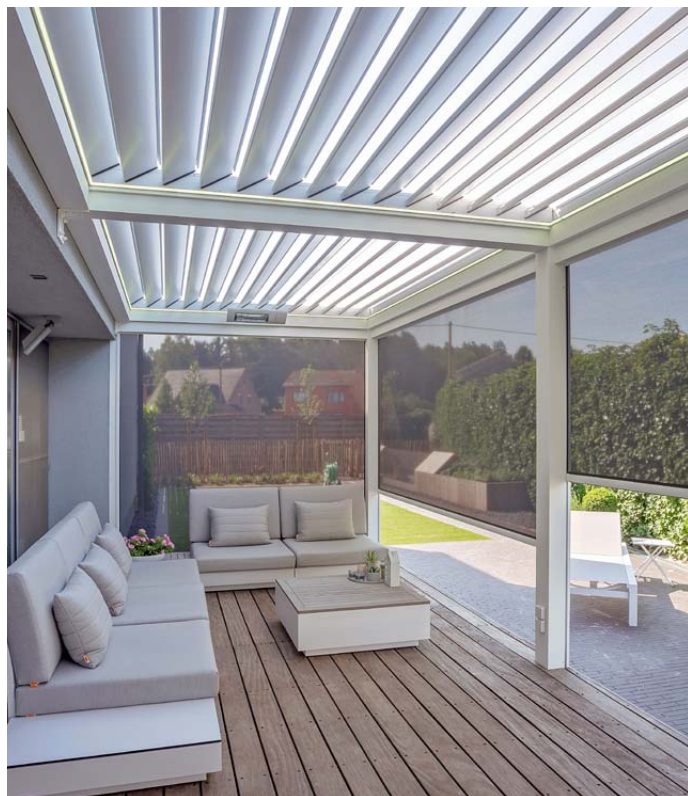
Skydedøre i glas JM-V764 eller med lameller JM-V755