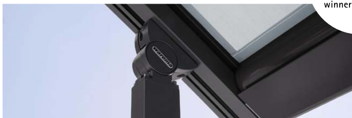
Pergolamarkise med lige sideskinner og integreret lys