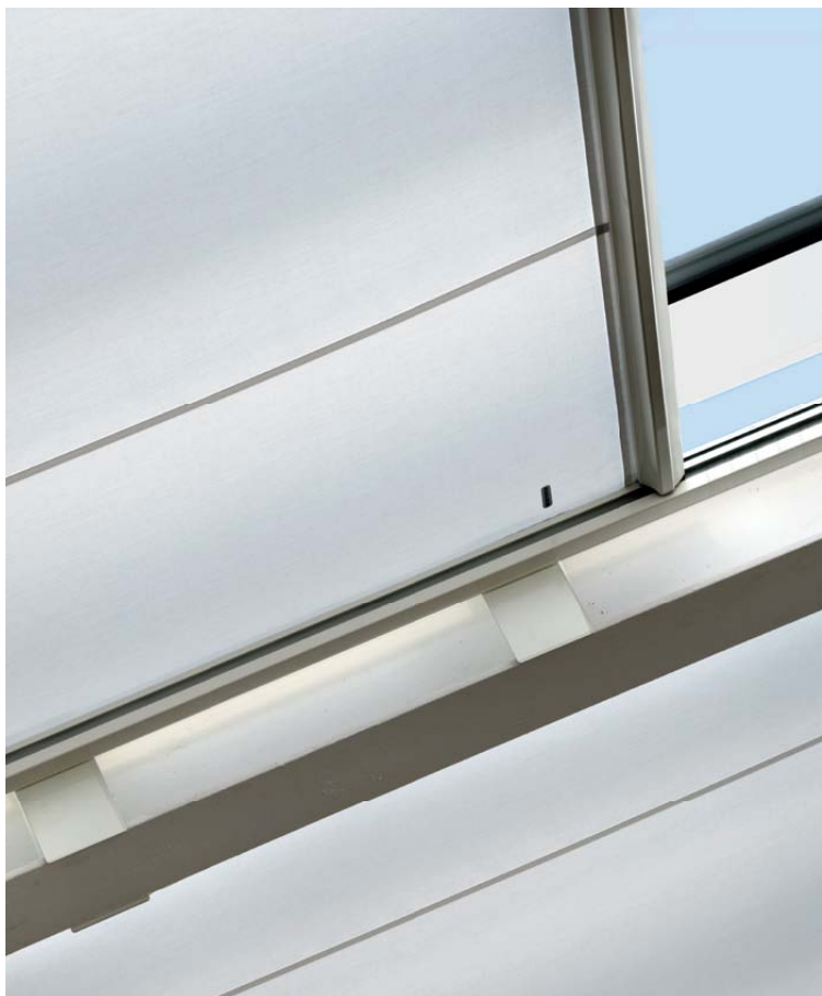
Ovenlysmarkiser, JM-W10 monteret på Egedal Rådhus