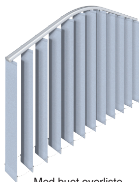
Med buet overliste