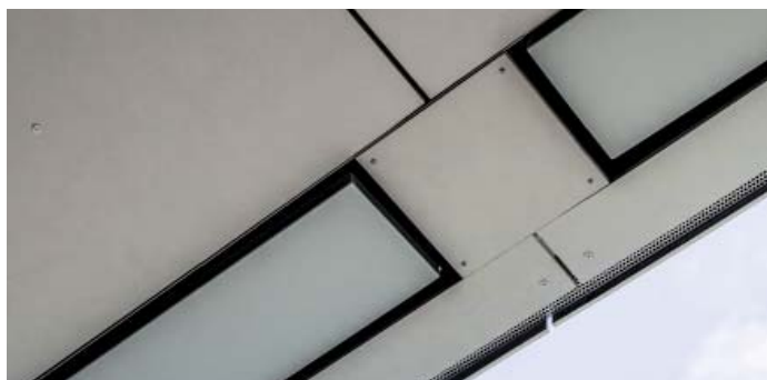
JM-700S indbygget vandret